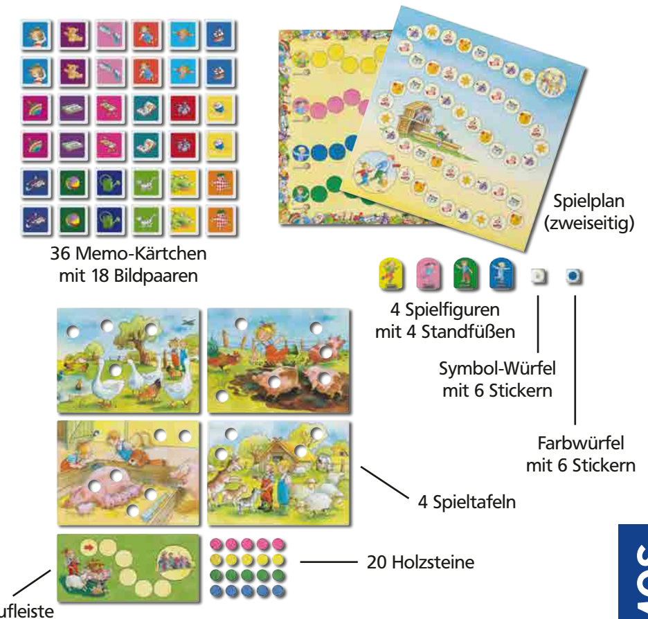
36 Memo-Kärtchen mit 18 Bildpaaren

Mit dieser Spielesammlung habt ihr gleich vier Spiele, die ihr gemeinsam mit Conni spielen könnt. Bei zwei Laufspielen, einem kooperativen Legespiel und einem Memo-Spiel lernt ihr ganz nebenbei erste Regeln und Spielabläufe kennen.